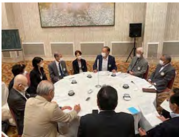
真剣なグループ討議

木更津RC・上総RCのグループ討議の内容は、1組・2組・3組共、参加していないので割愛させていただきます。