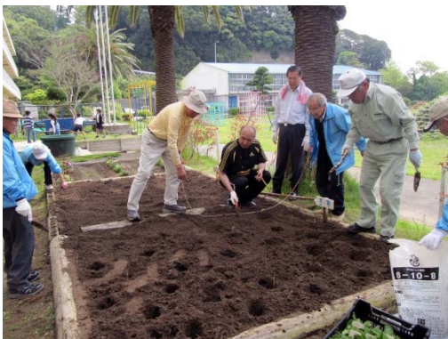
4/22 植栽前の準備(吉野小学校)