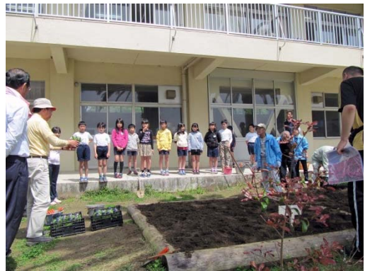
4/22 三井会員が花の植え方を生徒に説明 (吉野小学校)