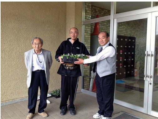
4/21 佐貫中学校にペチュニアの苗を寄贈