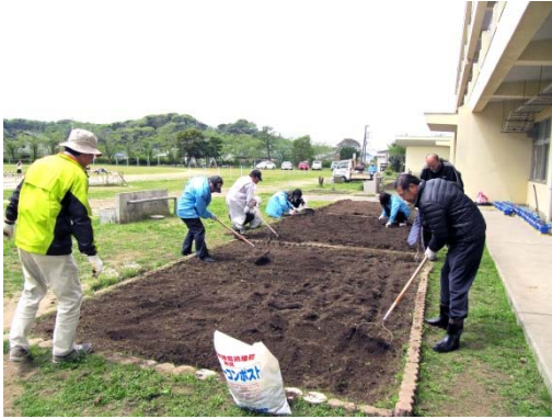
4/21 植栽前の花壇整備(大貫小学校)