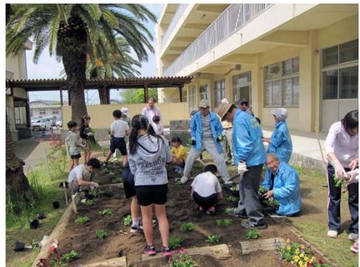
4/22 会員のサポートで生徒達が花植え (吉野小学校)