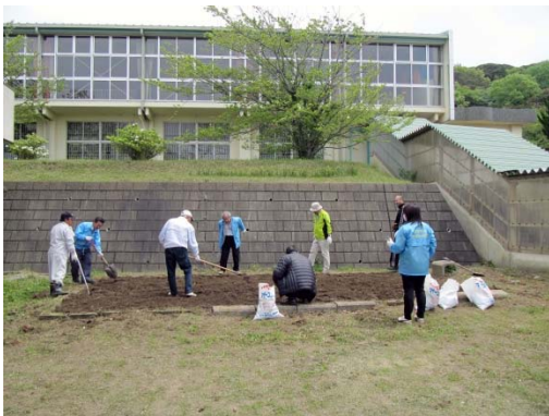
4/21植栽前の花壇整備(大貫小学校)