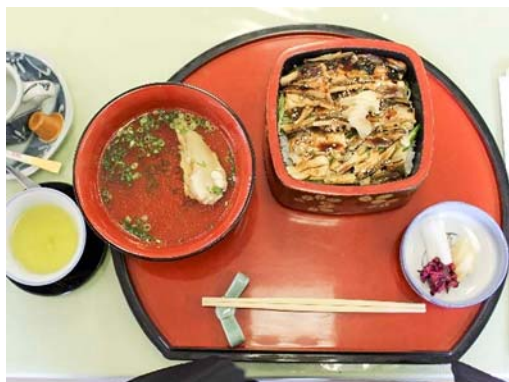
今日のランチ はかりめ重

採点結果報告 各班ともに博学のランクで優秀でした。さすがに富津中央ロータリークラブのメンバーです。9問正解の3班が自主採点でトップでした。全部の班に同じ賞品を渡しますが、トップの3班はニコニコをお願いします。