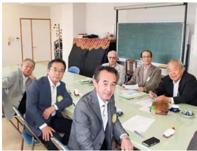
元優等生グループの1班