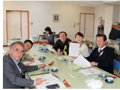
Dr.X「私は失敗いたしません」自信の4班