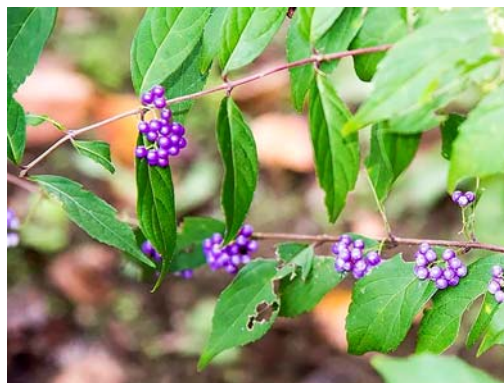
志波会員の庭のムラサキシキブ