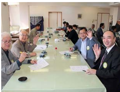
「ハイ全問正解です」の3班