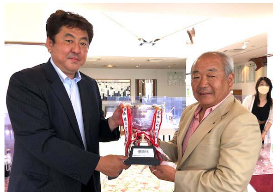
優勝した神子恒会員 (写真右)